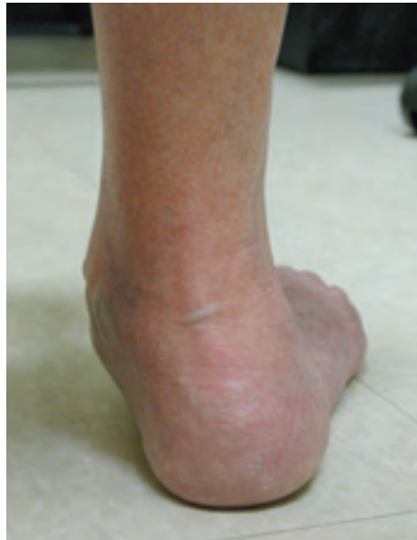
Photo 1. Vue de dos : valgus calcanéen important avec excès d'orteils

Une vue de dos révèle la présence d'un valgus (normalement < 10^\circ ) et d'une perte de hauteur de l'arrière-pied, d'une proéminence exagérée de l'os du talus, du naviculaire ou d'un excès d'orteils ( photo 1 ) (vue de plus de deux orteils en raison du valgus exagéré du calcanéum et de l'abduction de l'avant-pied).