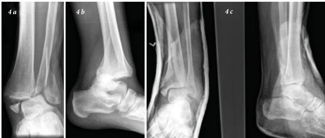
Figure 4. Deux radiographies d'une fracture-luxation de la cheville (a et b) et radiographie prise après la réduction (c).

la malléole postérieure, raison pour laquelle on parle de « fracture tri-malléolaire ». La blessure la plus grave survient lorsque l'astragale se déboîte, en se séparant de la mortaise, ce qui entraîne de multiples ruptures ligamentaires et (ou) fractures malléolaires (figure 4).