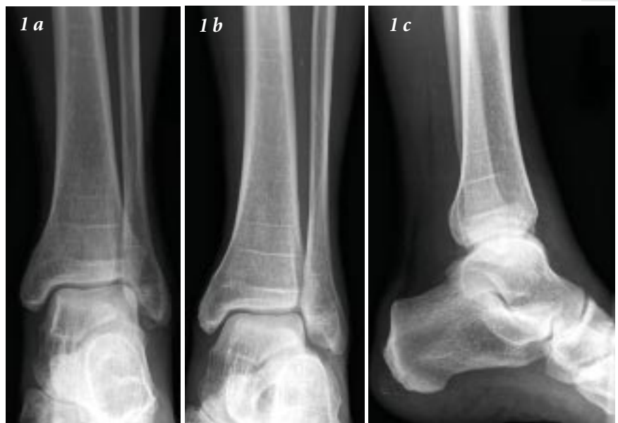
Figure 1. Les trois clichés radiologiques permettant d'évaluer un traumatisme aigu de la cheville : 1(a) vue de face ; 1(b) vue de mortaise ; 1(c) vue de profil. Il n'y a pas de fracture dans ce cas.

Le Dr Greg Berry, chirurgien orthopédiste, est professeur adjoint au Département de chirurgie de l'Université McGill, à Montréal.