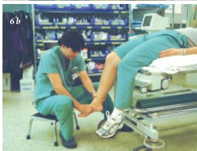
Figure 6. Position pour la manœuvre de réduction d'une fracture-luxation de la cheville. La patiente est sous sédation et le genou est fléchi à 90°, afin d'éliminer la tension au niveau gastrocnémien. Le médecin est assis confortablement, et exerce une traction modérée et constante.

des genoux, mais il faut s'assurer dans ce cas que la civière ne basculera pas sous le poids mal distribué (figure 6 b). Le genou doit absolument être fléchi pour relâcher la tension au niveau gastrocnémien, tension qui empêcherait toute tentative de réduction. Une fois le patient sous l'effet des sédatifs, le médecin exercera une traction modérée et constante, avec un léger appui vers l'intérieur. Il faut