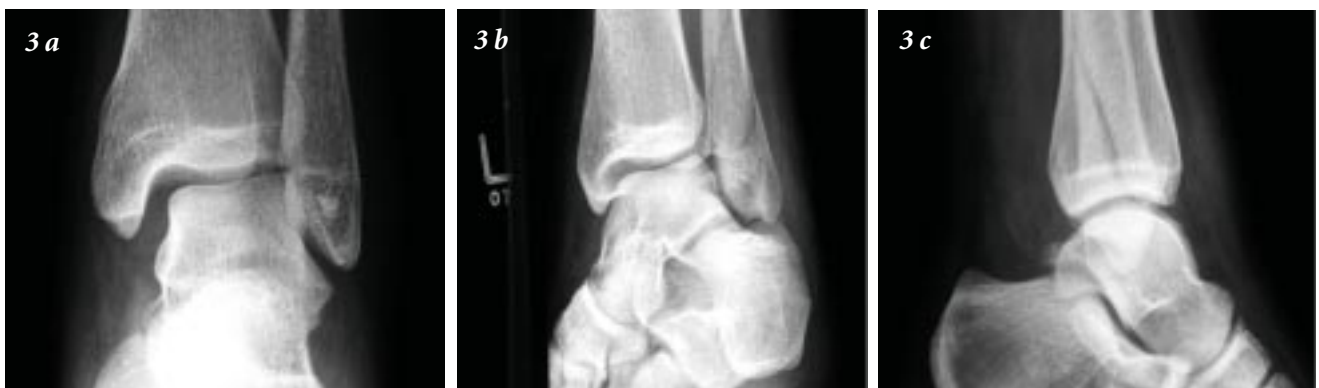
Figure 3. Trois radiographies d'une fracture de la malléole externe de la cheville. L'espace entre l'astragale, la malléole interne, la malléole externe et le plafond tibial n'est plus symétrique, témoignant d'un déplacement latéral de l'astragale (3a).

est en flexion plantaire, plaçant l'arrière-pied dans sa position la plus instable et la plus vulnérable. La capsule antéro-latérale et le LCAPA sont les premières structures mises sous tension qui se rompent. Si la force déformante persiste, le LCCP se rompt également. Le LCAPP est rarement atteint, sauf dans les cas de luxation. Le même mécanisme d'inversion et de torsion avec un vecteur de force différent peut causer une fracture spiralée de la malléole externe (figure 3). Si le choc est suffisamment fort, la malléole interne se fracturera ou le ligament deltoïde se rompra. Rarement, c'est le mécanisme qui intervient lors d'une fracture de l'aspect postérieur du tibia, appelé aussi