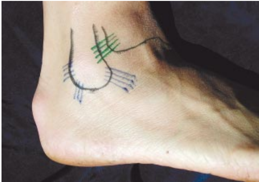
Figure 2. Les ligaments collatéraux externes (en bleu) et le ligament tibio-péronéen antérieur (en vert).

surprenant que la majorité des blessures de la cheville se fassent en inversion et en plantiflexion, la combinaison la plus instable possible.