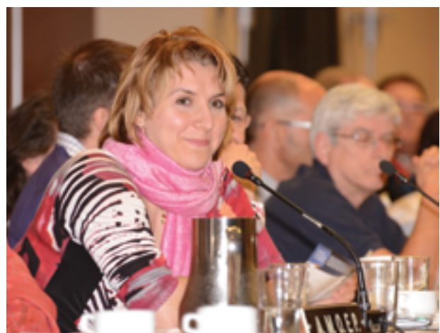
Déléguée à la réunion du Conseil de la FMOQ

La FMOQ se prépare à reprendre les discussions avec le gouvernement au sujet des groupes de médecine de famille (GMF). À la fin de janvier, elle a tenu deux grandes assemblées, l'une à Québec et l'autre à Montréal, auxquelles tous les représentants des GMF avaient été conviés. Ce fut un succès. Environ 90 % des groupes de la province étaient représentés.