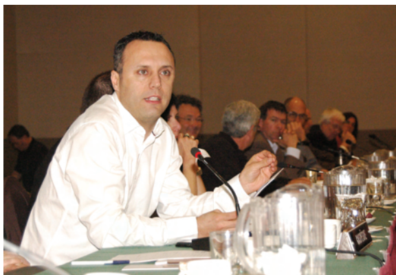
Des délégués à la réunion du Conseil de la FMOQ.

L'achat du matériel informatique est l'un des aspects importants de l'accord. Le Ministère paiera 70 % des frais, jusqu'à concurrence de 1400 $ (avant taxes), et le médecin, 30 %. Cette répartition des coûts vaut tant pour l'achat de l'ordinateur, de l'écran, de l'imprimante que pour l'installation, l'assurance et la garantie.