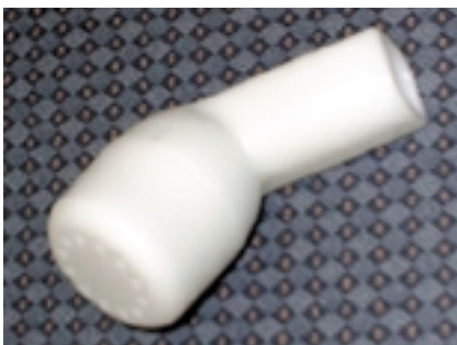
Photo 1. Flutter.

frant de MPOC. Pour le moment, on s'en sert comme approche complémentaire pour les personnes ayant de la difficulté à dégager leurs sécrétions. Le changement de position dans le lit toutes les deux heures peut favoriser la mobilisation des sécrétions. Le drainage postural en position de Trendelenburg (15 minutes ou selon la tolérance du patient) fait appel à l'effet de la gravité et peut être associé à un traitement de percussion thoracique ( clapping ) 12 . Il faut un personnel expérimenté pour évaluer si cette approche est utile au patient, car elle peut abaisser la saturation en oxygène 3 . L'enseignement aux proches peut être fait par un physiothérapeute ou un inhalothérapeute. La percussion n'est pas recommandée pour les patients souffrant de douleurs costales ou d'ostéoporose. Les agents mucolytiques comme le Mucomyst® (acétylcystéine) ont pour but de diminuer la viscosité des sécrétions tenaces 12 . Il est déconseillé de les utiliser régulièrement. Il faut associer l'acétylcystéine à un bronchodilatateur comme le salbutamol pour réduire le risque de bronchospasme. La prudence est recommandée pour les patients grabataires, qui ont de mauvais réflexes de toux, car elle peut provoquer une aspiration en augmentant le volume de sécrétions liquéfiées. On réservera les anticholinergiques en injection comme l'atropine