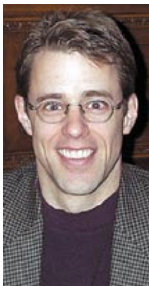
Le P r Benoît Lamarche.

Certains hommes dont la cholestérolémie est normale pourraient courir de grands risques d'avoir une cardiopathie ischémique. Pourquoi ? Parce que leur cholestérol se fixe sur les petites lipoprotéines de faible densité (LDL) plutôt que sur les grandes. « Chez des sujets dont le taux de cholestérol est normal, le risque de troubles cardiovasculaires est quatre fois plus élevé si plus de 40 % du cholestérol se trouve dans les petites particules que s'il est distribué dans les grosses », précise le P r Benoît Lamarche, de l'Université Laval, dont les travaux viennent d'être publiés dans Circulation 1 .