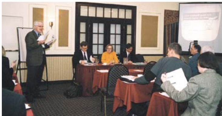
Journée de formation organisée par la FMOQ et le MSSS.