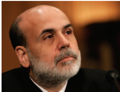
M. Ben S. Bernanke

Le nouveau président endosse le mandat à deux volets de la Fed , en l'occurrence la stabilité des prix et la maximisation de l'emploi. Selon lui, il est insuffisant de viser exclusivement la stabilité des prix, comme l'exige le mandat de la Banque centrale eu-